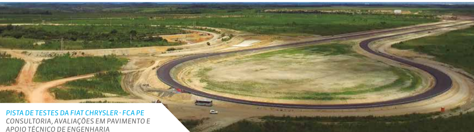
PISTA DE TESTES DA FIAT CHRYSLER - FCA PE CONSULTORIA, AVALIAÇÕES EM PAVIMENTO E APOIO TÉCNICO DE ENGENHARIA