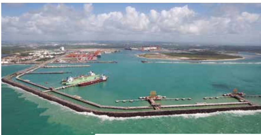
COMPLEXO PORTUÁRIO DE SUAPE - PE IMPLANTAÇÃO DE SISTEMA DE GESTÃO DE MANUTENÇÃO