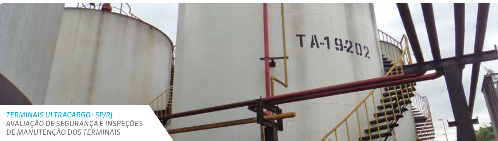
TERMINAIS ULTRACARGO - SP/RJ AVALIAÇÃO DE SEGURANÇA E INSPEÇÕES DE MANUTENÇÃO DOS TERMINAIS