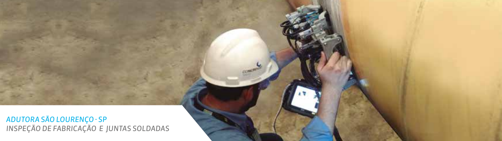
ADUTORA SÃO LOURENÇO - SP INSPEÇÃO DE FABRICAÇÃO E JUNTAS SOLDADAS