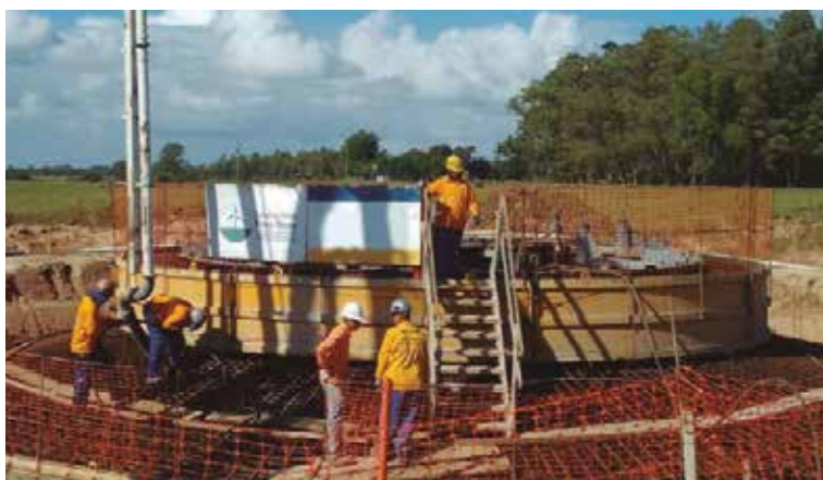
COMPLEXO EÓLICO POVO NOVO - RS CONTROLE TECNOLÓGICO