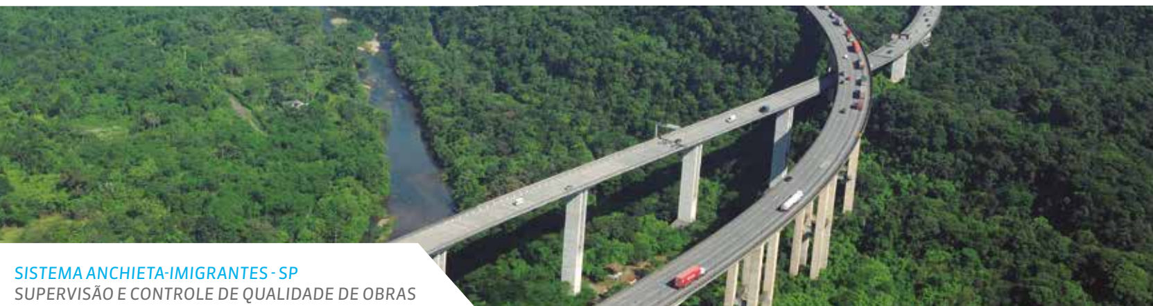
SISTEMA ANCHIETA-IMIGRANTES - SP SUPERVISÃO E CONTROLE DE QUALIDADE DE OBRAS