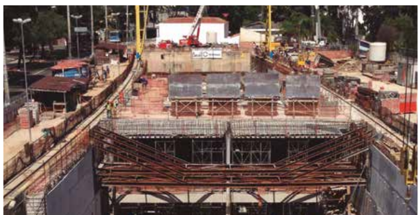
METRÔ LINHA 5 (LILÁS) - SP INSTRUMENTAÇÃO GEOTÉCNICA E CONTROLE TECNOLÓGICO