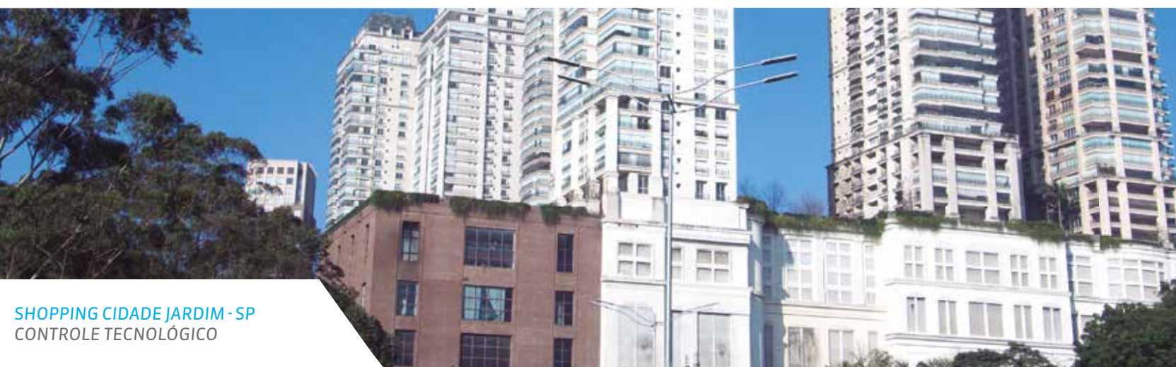
SHOPPING CIDADE JARDIM - SP CONTROLE TECNOLÓGICO